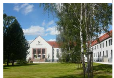
Campus Scheffelberg der Westsächsischen Hochschule