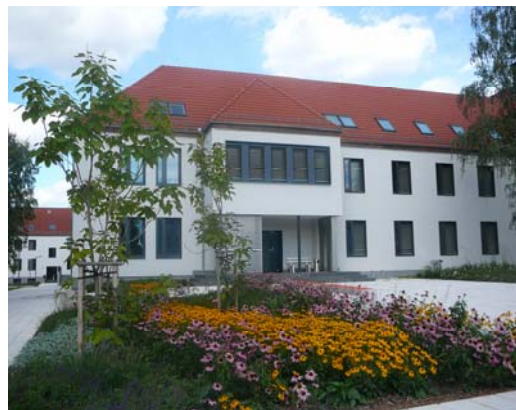
Eindrücke vom Campus Scheffelberg der Westsächsischen Hochschule in Zwickau

Als kleiner Anreiz für die iatefl Mitgliedschaft sei noch angemerkt, dass der Gesamtkongress in diesem Jahr vom 15.–19. April in Brighton stattfindet. Nähere Informationen unter www.iatefl.org .